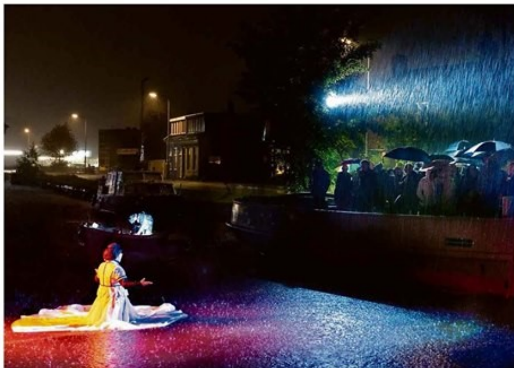
Het theaterspektakel De Dochter van Martenshoek speelde zich deels af in de stromende regen in het water van het Oude Winschoterdiep.